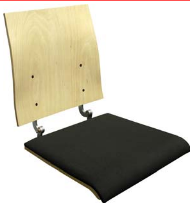
CON ASIENTO TAPIZADO